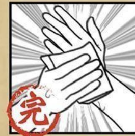
清水沖淨 並擦乾雙手