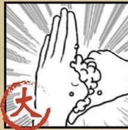
搓揉大拇指 及虎口